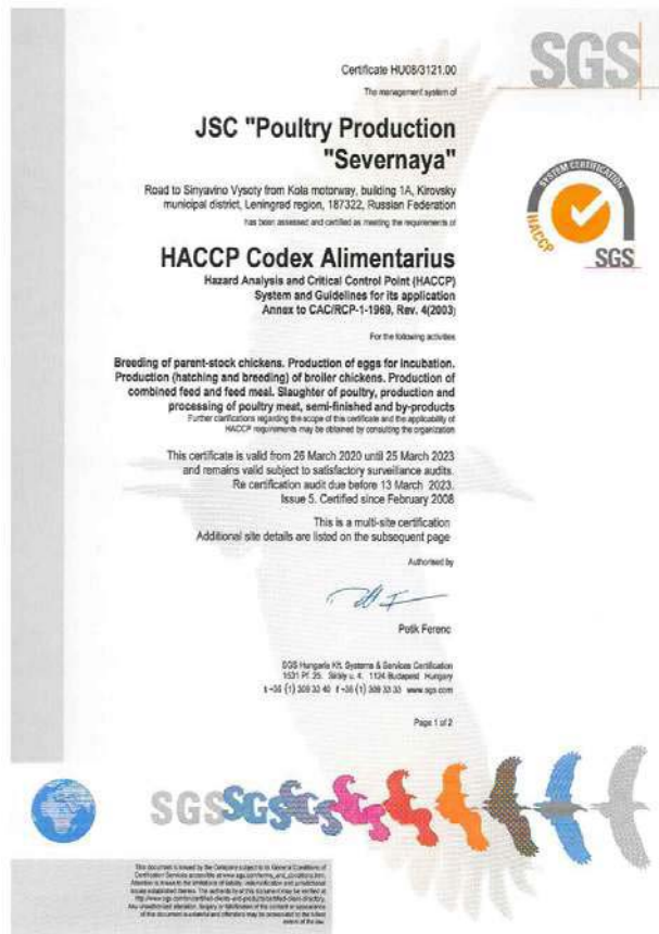
HACCP Codex Alimentarius